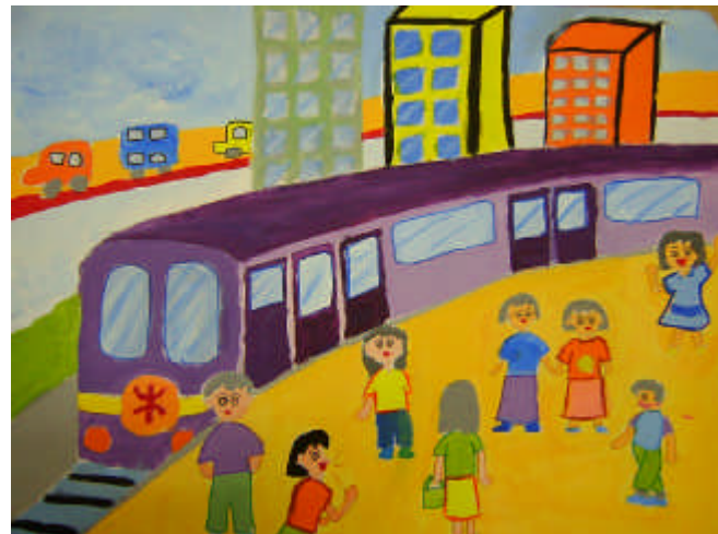
學生作品 3 (地鐵月台)