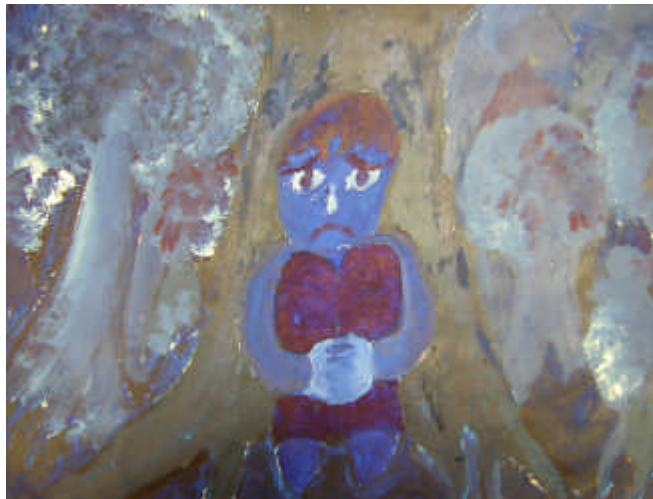
學生作品 1 (憂鬱的)