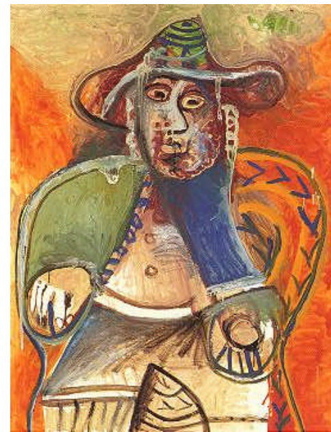
畢卡索 (年輕的女人)