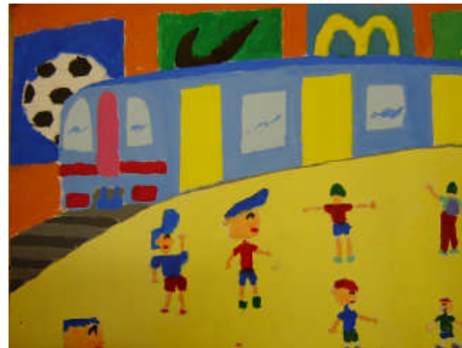
學生作品 4 (地鐵月台)