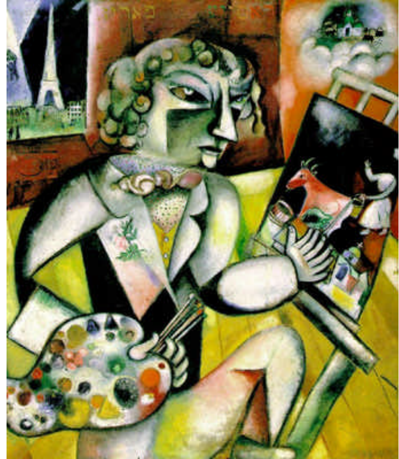
夏卡爾 (七個指頭的自畫像)